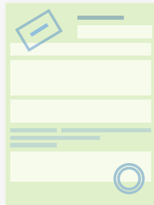
Страховой полис ОСАГО с электронной подписью

После оплаты в ваш личный кабинет и на e-mail придут электронные документы, которые вы можете распечатать: